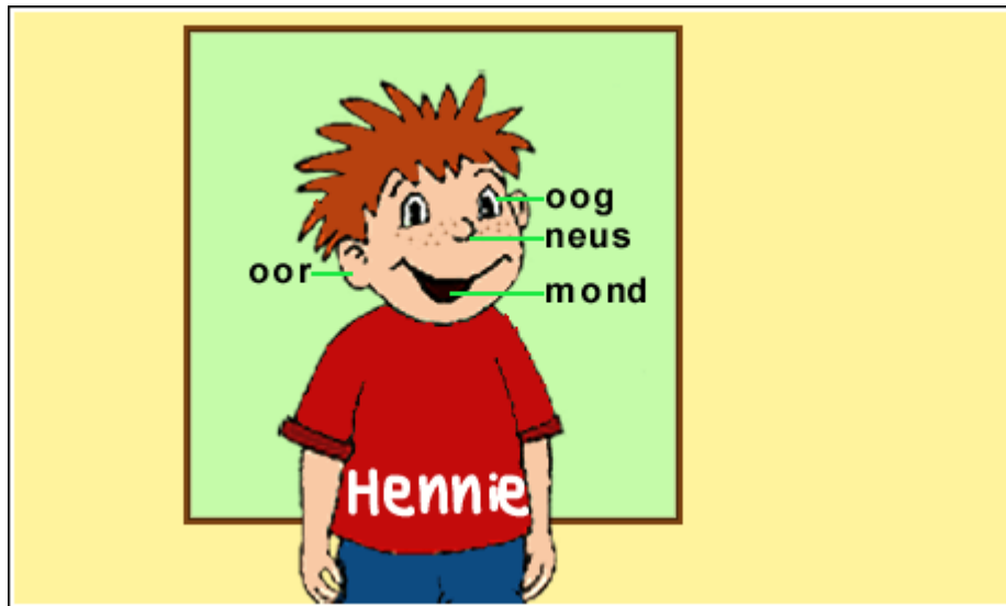
Skets 1: 1RCA21.GIF

Vrae 1 tot 6 verwys na die volgende skets