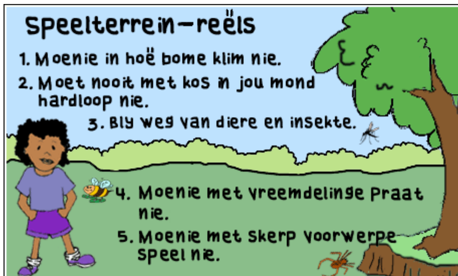
Skets 2: 2anv19