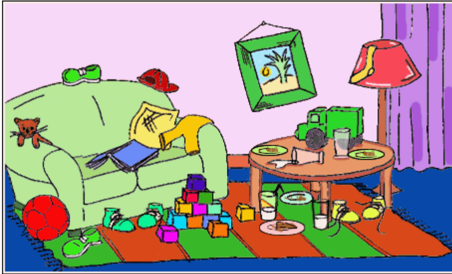
Skets 3: 2VZ8.GIF

Vrae 3 tot 4 verwys na die volgende skets