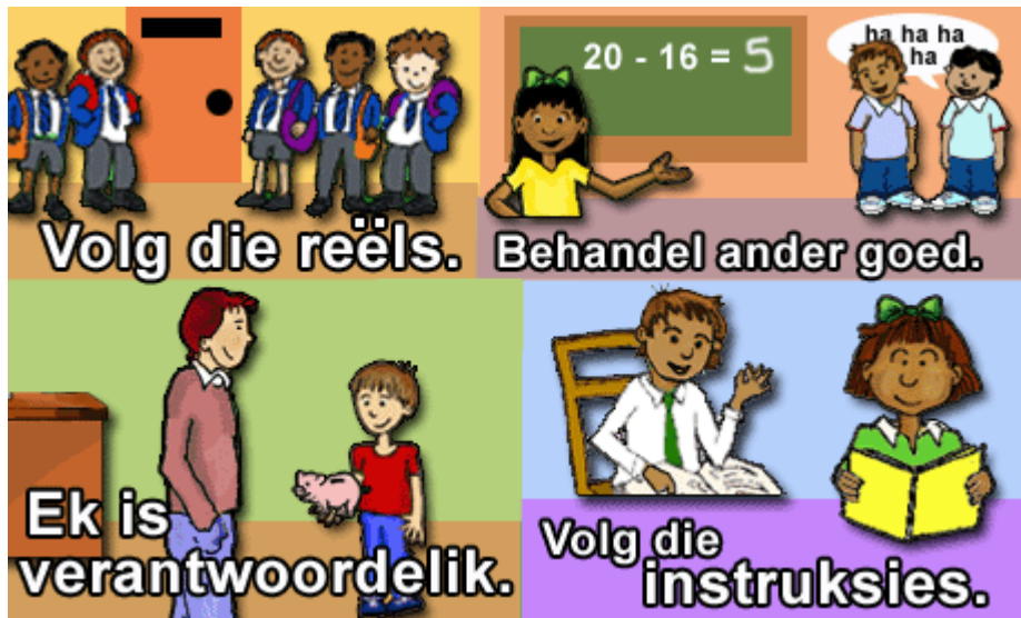
Skets 5: 3MCA50.GIF