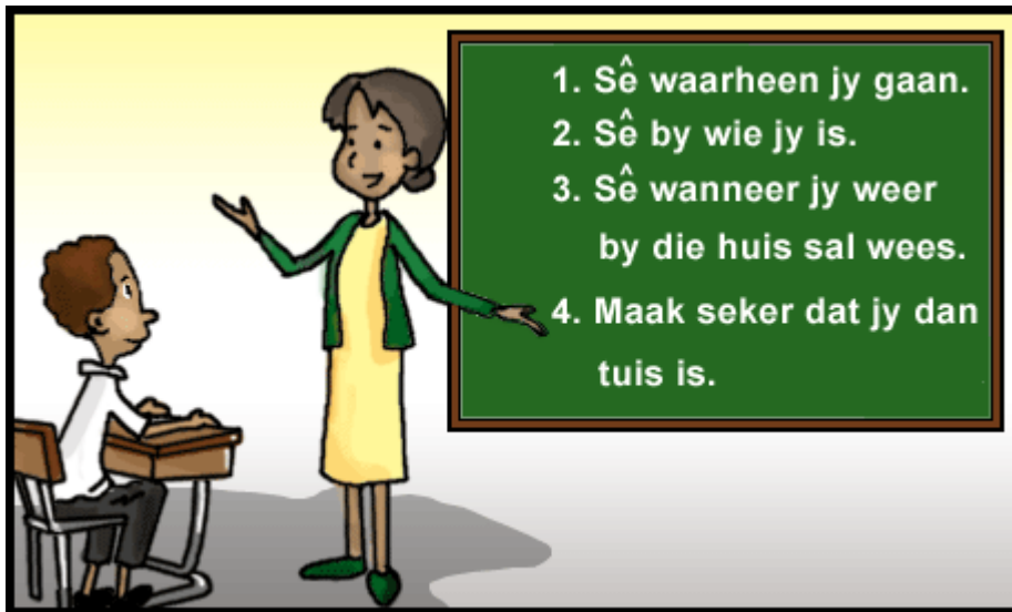
Skets 1: 2MCA17.GIF