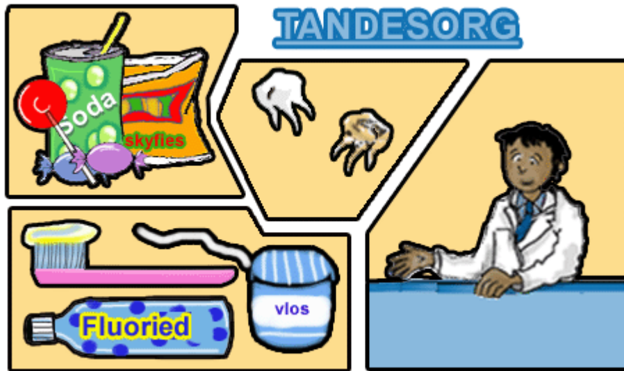
Skets 1: 3MCA35.GIF

Vrae 1 tot 5 verwys na die volgende skets