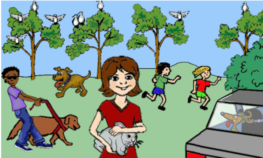
Skets 1: 3MC64.GIF

Vrae 1 tot 2 verwys na die volgende skets